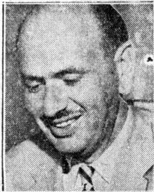
Radiochefen optimistisk trots allt.

Nej, det är uppenbart att den statliga kommittén är det största orosmolnet just nu.